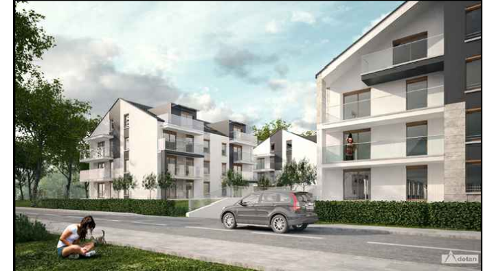
BUDYNEK NR 3