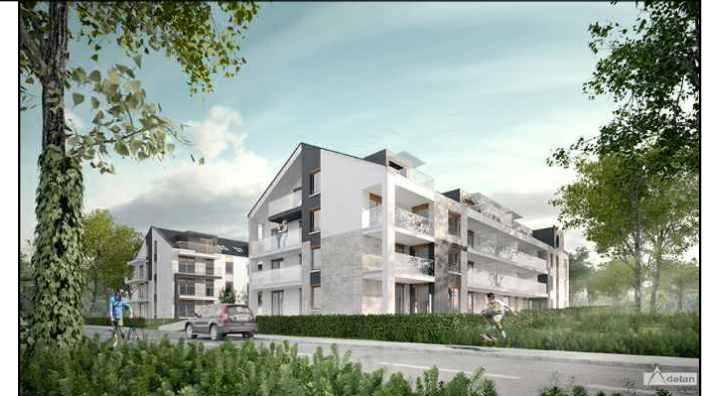
BUDYNEK NR 1