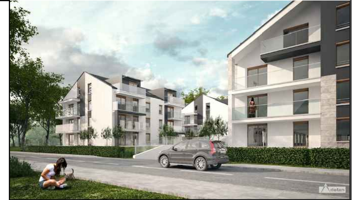
BUDYNEK NR 3