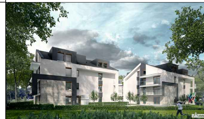
BUDYNEK NR 2

INWESTOR: Przedsiębiorstwo Budowlane "CHAŁUPKA" Spółka Jawna ul. Karbońska 1 25-640 Kielce