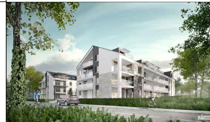
BUDYNEK NR 1